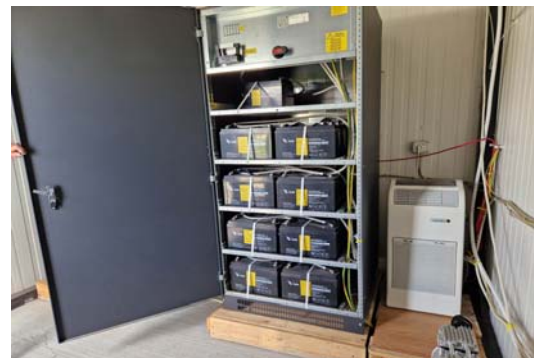
Ospedale "Redemptoris Mater" di Ashotsk (Armenia) Medicinali e attrezzature sanitarie