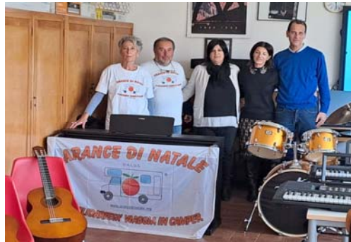
Scuola Media Mercuriale di Forlì Strumenti e attrezzature laboratorio di musica