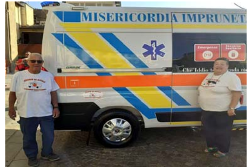
Misericordia di Impruneta Attrezzature per ambulanza