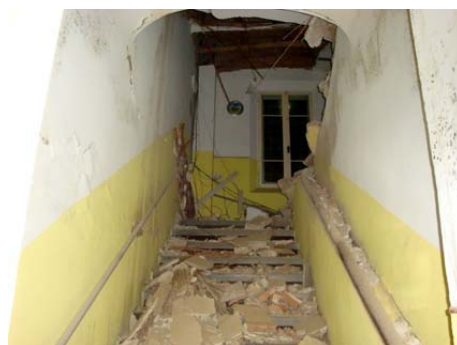
Scuola di Alberone di Cento - Ferrara (terremoto 2012) Acquisto materiali didattici e sussidi