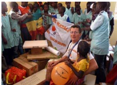
Scuola di Pikine (Senegal) Acquisto generatore corrente elettrica