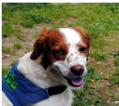
Associazione U-Dog di Vicenza Goa e Pimpa, cani da utilità acquistati e addestrati per aiutare persone disabili