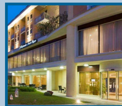
Hotel Rizzi Aquacharme