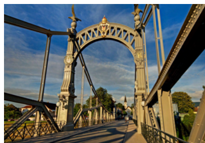
Ponte di confine tra Laufen ed Oberndorf