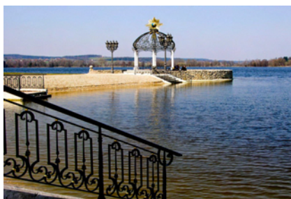
Lungolago di Waging