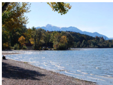
Lago di Taching